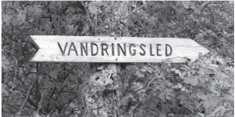
En skylt visar var jag ska hoppa över diket för att komma in på gamla kyrkvägen.