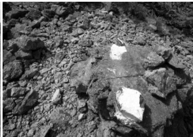
Leden över Kalen är märkt med vitmålade stenar och pilar.