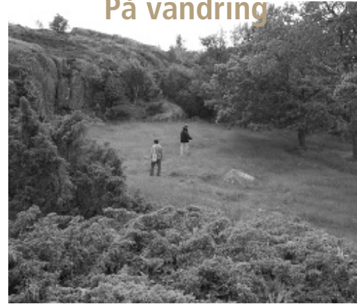
Otterböte bronsåldersboplat.

MITTEMOT OTTERBÖTE reser sig Vaktanböte. Av namnet framgår att berget tillhört den fornnordiska vaktkedjan då eldar tändes för att signalera. Här syns att Kökar är ett berglandskap. Berggrunden är varierande och består av urbergets grå gnejs och gnejsgraniter. Förkastningar, stenåkrar och spår efter inlandsisen gör geologin spännande. Rundhällar, isräfflor, parabel-