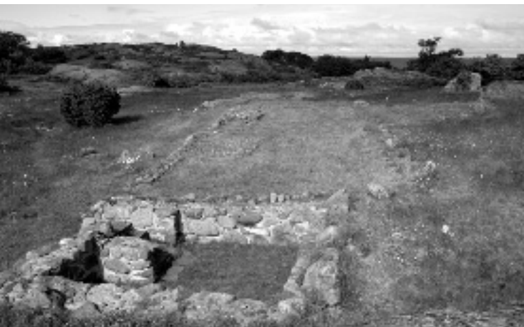
Södra huset, daterat till 1300-talet.

Till vänster om dörren hänger fattigbössan och jag sneglar mot den utstötta Brita-Lisas bänk längst bak i kyrkan. Jag skriver mitt namn i gästboken och vandrar mot altaret. Ser upp till läktaren med sin vackra orgel, konstaterar som alltid att kyrktaket från insidan liknar en upp och nedvänd båt. Vid varje besök vill jag gå